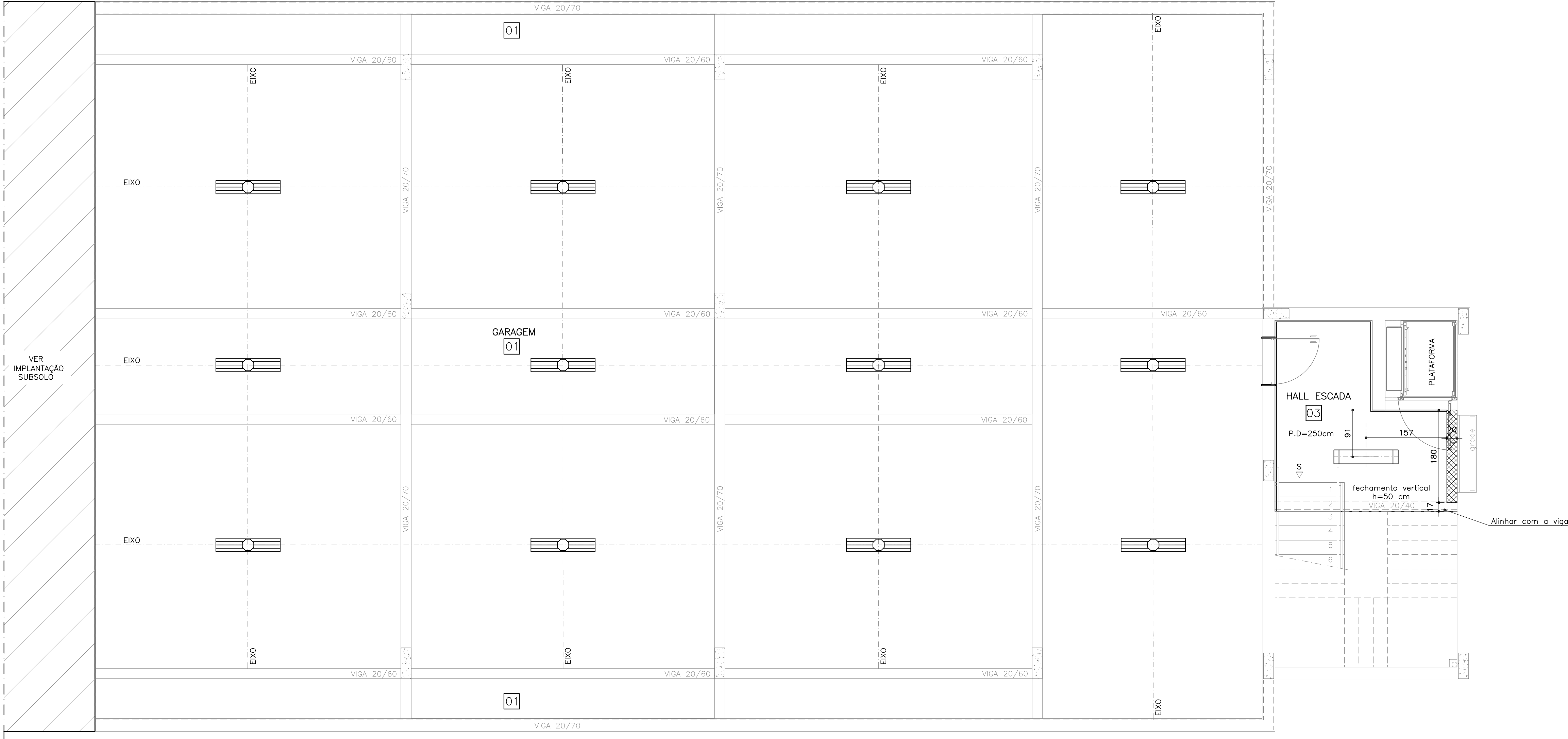
PLANTA DE FORRO E LUMINÁRIAS – SUBSOLO ESCALA 1:50